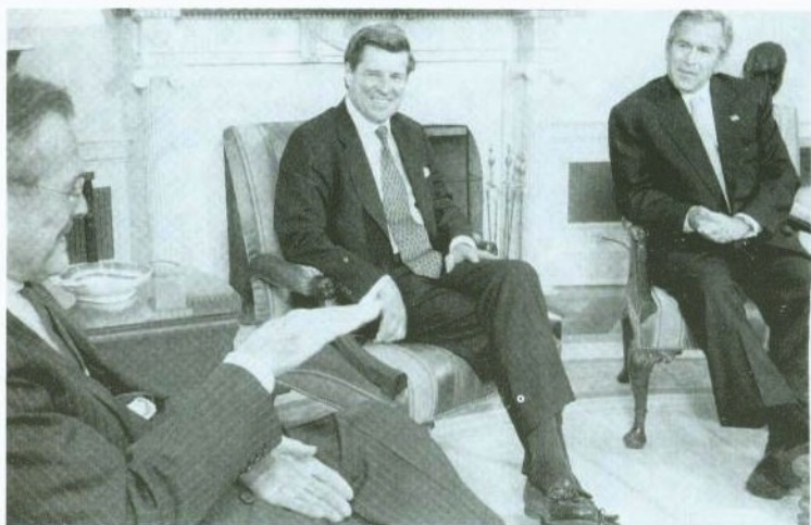
1 اجتماع في المكتب البيضاوي في 6 أيار/مايو، مع الرئيس جورج دبليو بوش ووزير الدفاع دونالد رامسفيلد